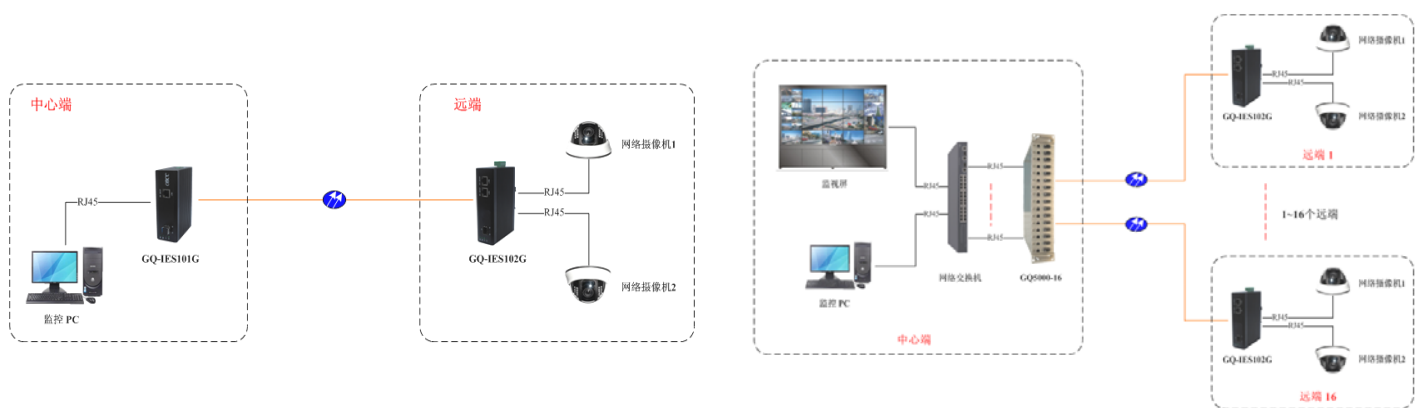
方案一: 点对点应用