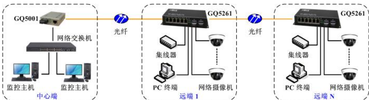
方案一：光纤多点组链型网络