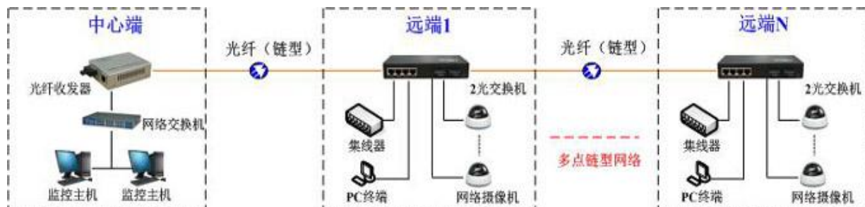
方案一：光纤多点组链型网络