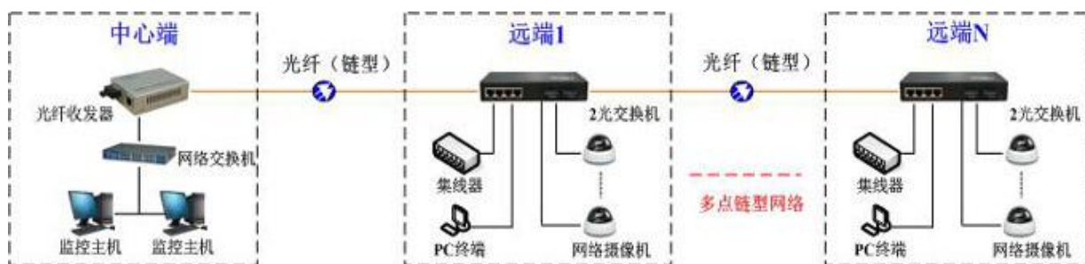
方案一：光纤多点组链型网络